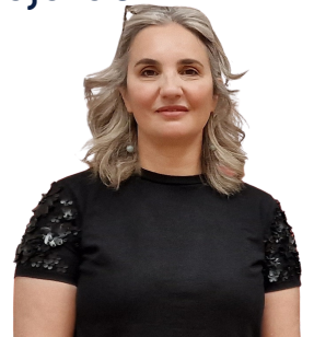
Product Manager de Google

Esta zaragozana que estudió ingeniería industrial "por pragmatismo" y "sin una vocación clara", es hoy Directora Senior de Productos en Google, liderando el equipo de producto de Gmail, una aplicación de email utilizada por más de 3.000 millones de personas. Lleva 20 años a la vanguardia de las tecnologías emergentes, liderando el desarrollo y lanzamiento de productos para consumidores y empresas a nivel mundial. Nos transmitió su pasión, dedicación y también la importancia de los referentes cercanos en una charla muy inspiradora.