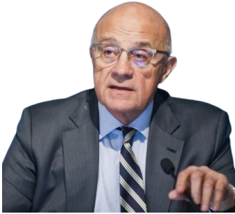
Josep Oliu Presidente de Banco Sabadell

La tertulia económica protagonizada por Josep Oliu ha sido una gran oportunidad para conocer de primera mano la visión sobre el nuevo paradigma económico y bancario de uno de los referentes del Ibex 35. El Presidente de Banco Sabadell se ha mostrado optimista respecto a la evolución económica, si bien considera que las decisiones de inversión empresarial, así como las de los ciudadanos en cuestiones con elevado coste para sus economías domésticas, se están viendo contenidas por la inflación y los incrementos de los tipos de interés.